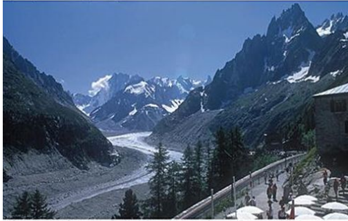
Mer de Glace bei Montanvert, Chamonix / Frankreich, 14.8.2001

L'image représente deux photographies d'un même paysage : une en noir et blanc, l'autre en couleur. Descriptions dans le texte ci-dessous.