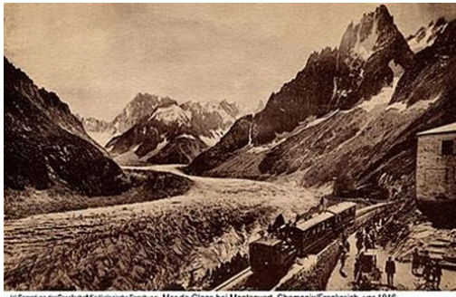
Mer de Glace bei Montanvert, Chamonix/Frankreich, vor 1916